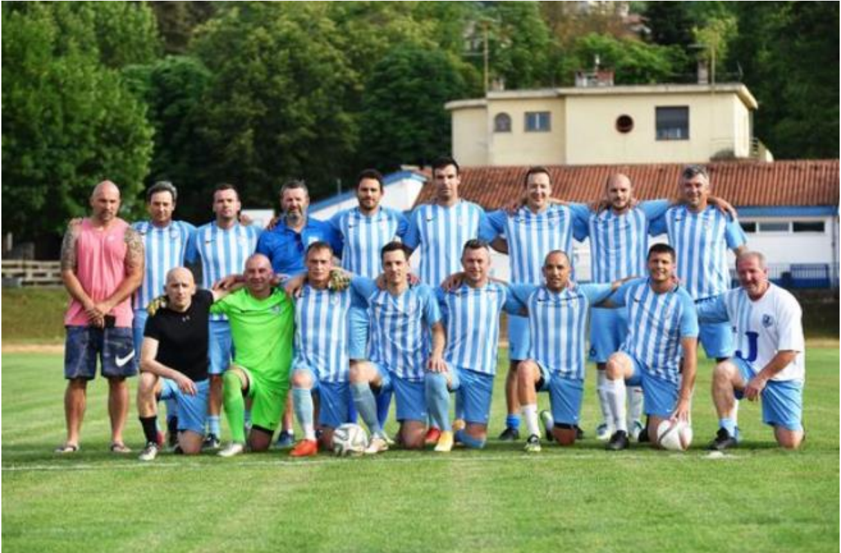
NK JADRAN POREČ – veterani 2021./2022.